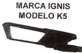
MARCA IGNIS MODELO K5

Referencia: Adquisición de Luminarias LED para la Iluminación del Camino Público N°6