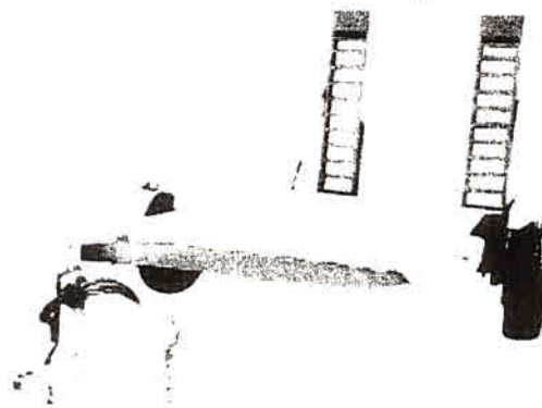
Imagen a modo ilustrativo